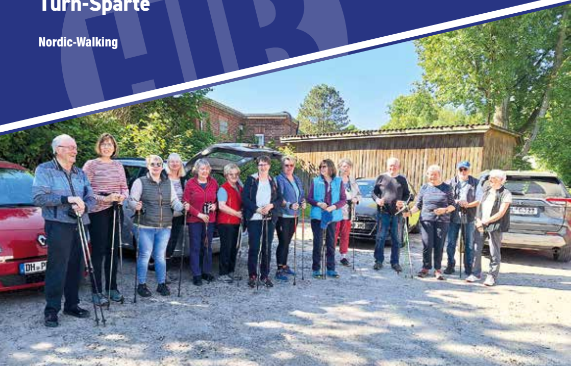
Start auf dem Parkplatz Restaurant „Zum Mühlenteich“. In zwei Gruppen walkten wir durch den Erdmann Wald in Neubruchhausen.