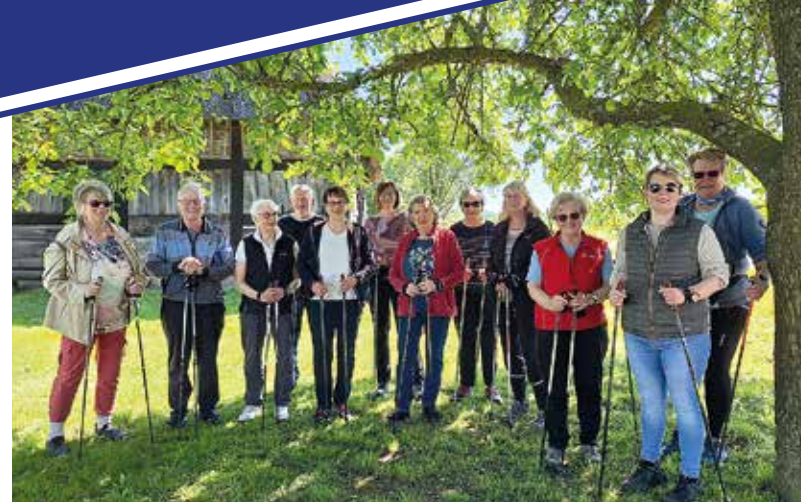
Vor dem wohlverdienten Essen im Restaurant trafen sich die Gruppen im Scheunenviertel.