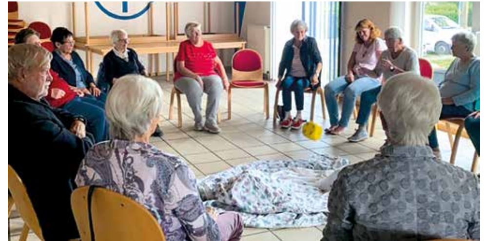
Gehirnjogging für Senioren im Vereinsheim.