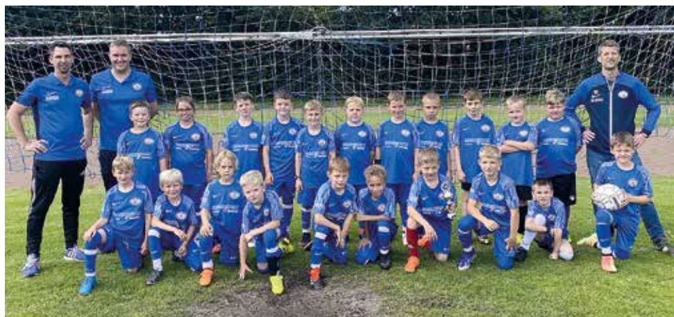
F-Jugend - U9